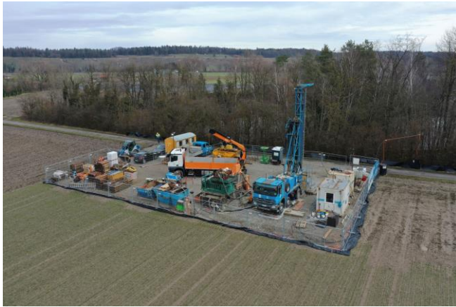
Luftaufnahme einer Quartärbohrung in Adlikon

Die Nagra bohrt ab Ende August 2020 nördlich von Dätwil an der Thur. Anders als bei einer Tiefbohrung, bohrt die Nagra in Dätwil aber nur rund 300 Meter in die Tiefe. Die Nagra will verstehen, wie die Gletscher die Landschaft um Adlikon geprägt haben – und in Zukunft prägen werden. Für alle Anwohnenden findet am Donnerstag 20. August um 19 Uhr ein Informationsanlass vor Ort statt.